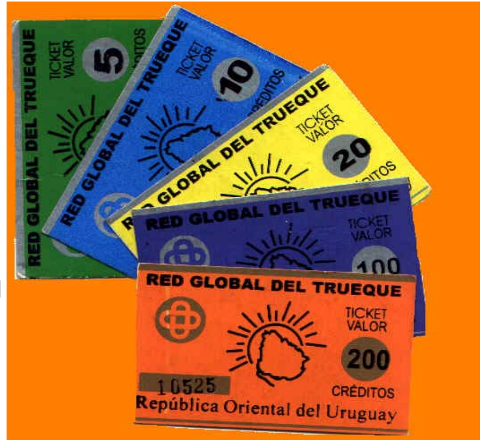
„Créditos“ d. „Globalen TR-Netzwerkes“, Uruguay