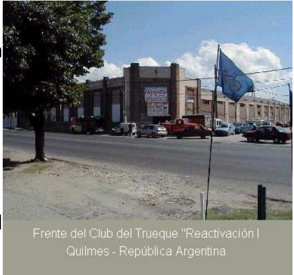
Frente del Club del Trueque "Reactivación I" Quilmes - República Argentina